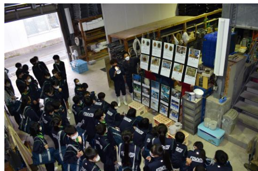
魚類生産に関する講義