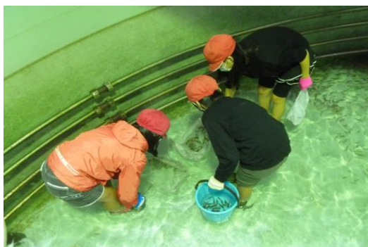
イサキ稚魚の取り上げ